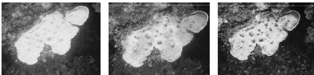
Fig. 3 A. Colonia del género Montastraea , tomada el 15 de noviembre de 2005. B. Colonia del género Montastraea , tomada el 11 de diciembre de 2005. C. Colonia del género Montastraea , tomada el 12 de enero de 2006

Fig. 3 A. Colony of the genus Montastraea , picture taken November 15, 2005. B. Colony of the genus Montastraea , picture taken December 11, 2005. C. Colony of the genus Montastraea , picture taken January 12, 2006