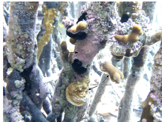
Figura 2. Corales pétreos asociados a algas calcáreas costrosas del género Neogoniolithon .

En el conjunto de los sitios se identificaron 11 especies de corales pétreos, de las 39 consignadas para los arrecifes de la zona (Hernández-Fernández et al. , 2011), pertenecientes a 7 géneros (Tabla 1). En 2010 ocuparon el 13 % de las raíces observadas y en 2012, el 14 %. La especie predominante fue Porites astreoides Lamarck, 1816; seguida de Porites divaricata Lesueur, 1821. El 100% de las colonias se encontraron en asociación con algas costrosas coralinas, fundamentalmente, del género Neogoniolithon (Fig. 2).