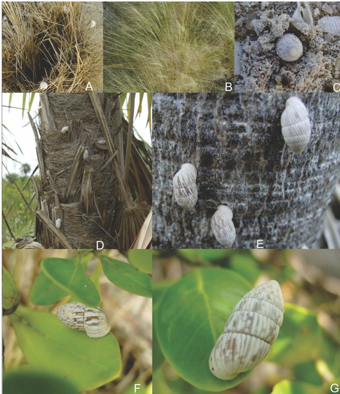
Figura 2. Cerion santacruzense sobre diferentes sustratos y plantas en los cayos Anclitas I y II, Cachiboca y Caguama en el Parque Nacional Jardines de la Reina. A y B: sobre Schizachyrium gracile ; C: enterrado en la arena; D y E: sobre macolla y tronco de Coccothrinax litoralis ; F: sobre hoja de Erithalis fructicosa ; G: sobre hoja de Strumphia maritima .

de agregación observado en este estudio pudiera estar relacionado con alguna característica del hábitat como ha sido documentado por varios autores (Cowie, 1984; Oliva-Olivera, 2004; Fiorentino et al. , 2009; Suárez et al. , 2012). Quizás esta agregación se deba a que Schizachyrium gracile , la planta más utilizada, se caracteriza por su reproducción